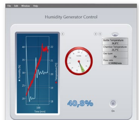
Feuchteregelung mit SCH 20