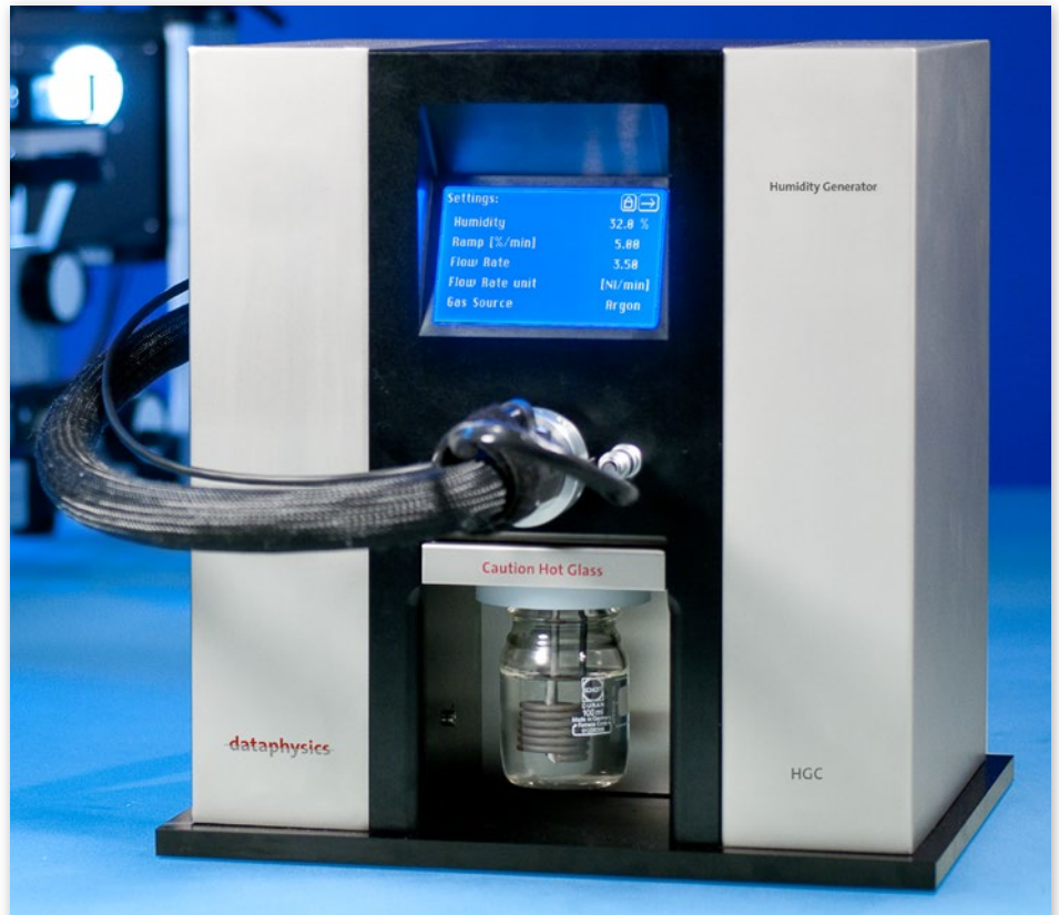
Feuchtegenerator und -regler HGC 30

Das System ist dank integriertem Touchscreen auch ohne zusätzliche Software bedienbar und somit sofort einsatzbereit.